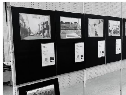
美須賀コミュニティ センター文化祭 (2023年11月12日)