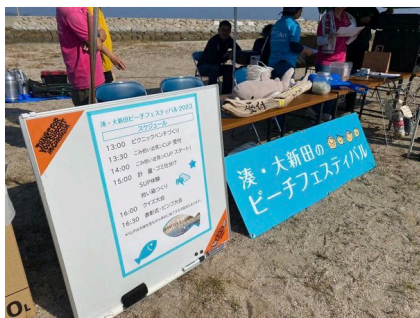
湊・大新田 ビーチフェスティバル (2023年11月5日)