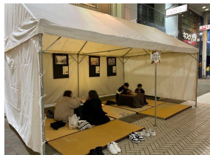
今治商店街 ヨル街楽座 (2024年2月3日)