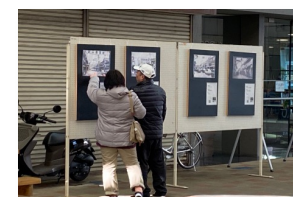
今治商店街 えびす市マルシェ (2024年2月11日)